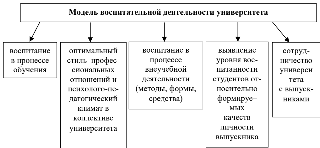
Рисунок 2. Модель воспитательной деятельности университета

Модель воспитательной деятельности университета представлена на рисунке 2.